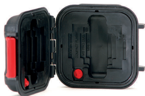
*Memory card case