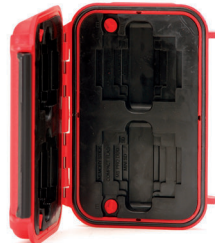
*Memory card case